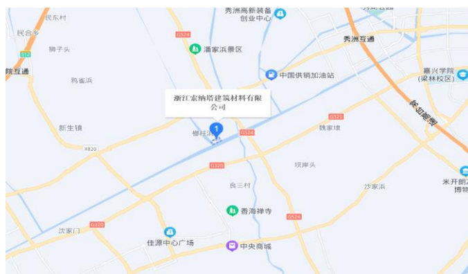
图 3.1 地理位置图