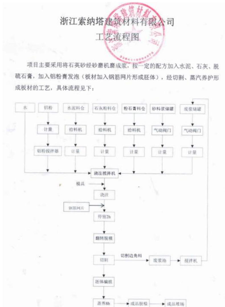
图 3.3 生产工艺流程图